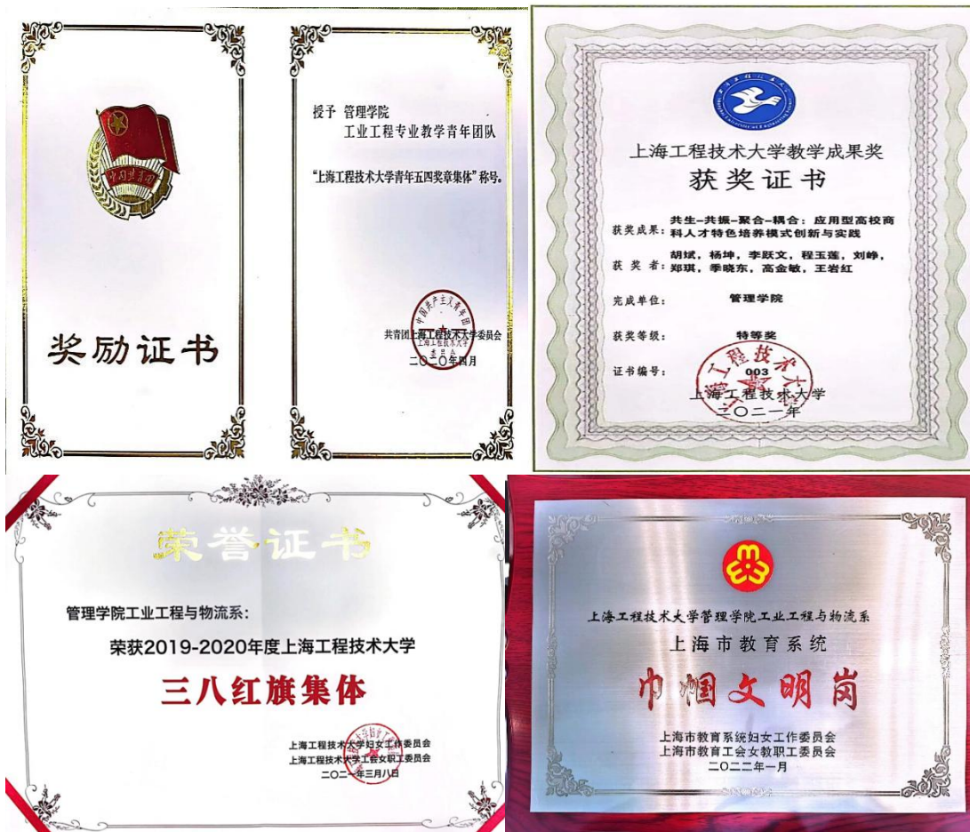
表 1 专业基本情况